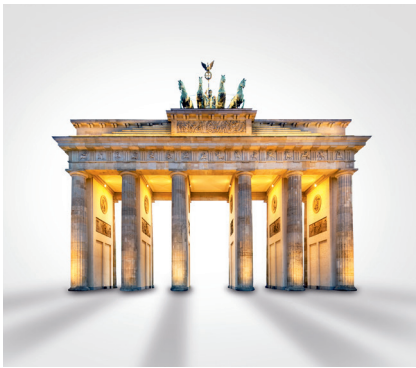
Profitiert von den Chancen des deutschen Aktienmarktes: Commerzbank Aktientrend Deutschland