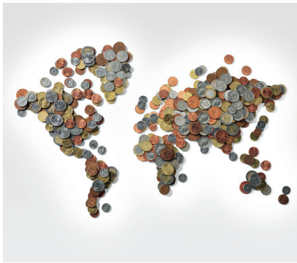
Unterschiedliche Zinsniveaus in verschiedenen Ländern bieten attraktive Gewinnchancen.