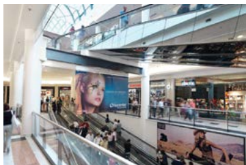
Orio Center (Shopping-Center), Bergamo, Italien