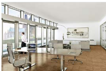
Neue Direktion Köln (Projektentwicklung, Büro), Köln, Deutschland