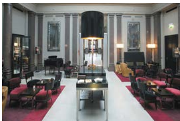
Hotel de Rome (Hotel), Berlin, Deutschland