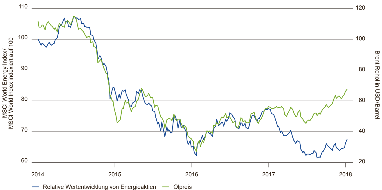
Abbildung 3: Energieaktien koppeln sich vom Ölpreis ab

Indizes werden nicht aktiv verwaltet und es ist nicht möglich, direkt in einen Index zu investieren.